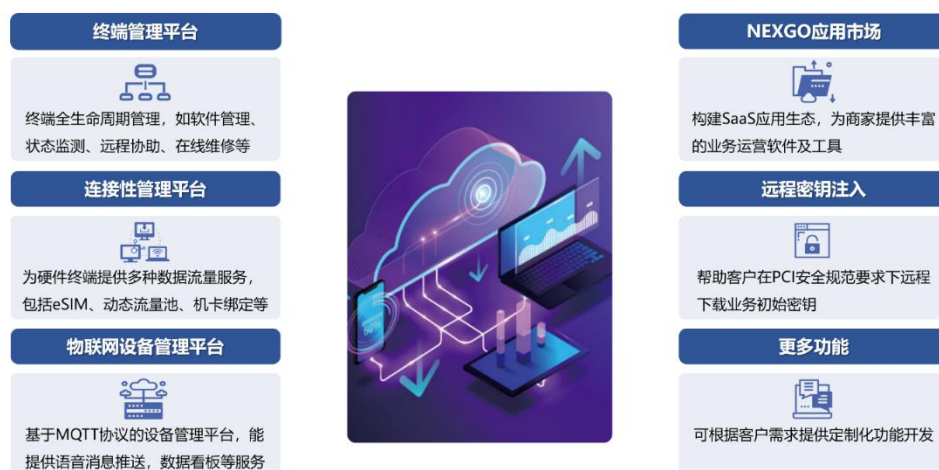
NEXGO Cloud 云端综合服务平台主要功能

报告期内，公司电子支付设备业务板块实现营业收入 9.41 亿元，海外市场实现营业收入 9.01 亿元，其中欧美日海外高端市场实现营业收入 2.71 亿元，同比增长 63.61%。